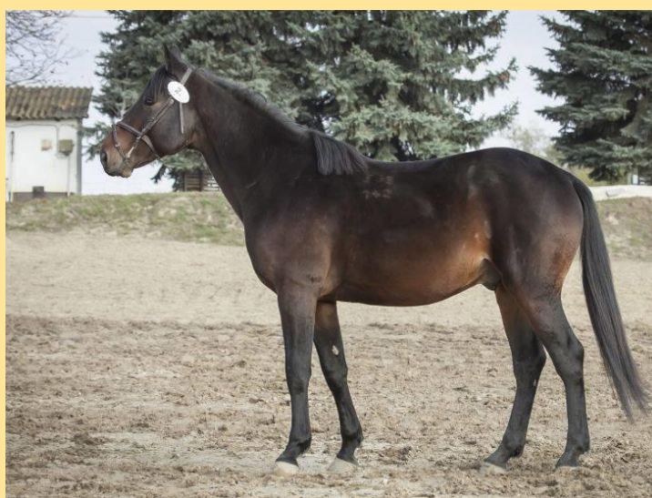
Furioso IV (2012) „A” vonal

Miénk a felelősség, hogy ez az utódainké is lehessen, jó úton járunk. A dinasztia, a törzsfa kezünkbe került ágai nem száradtak el, hanem virágzó hajtásokat hoznak. Ehhez kívánok erőt, egészséget, kitartást a jövőben is.