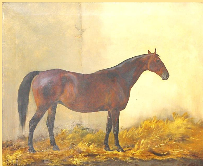
Furioso Senior (1836)

Az örökség a kezünkben van! (bizonyáságul a törzsalapító és hajtásai)