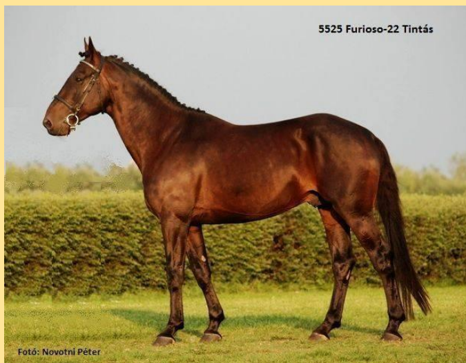
Furioso II (2010) „B” vonal