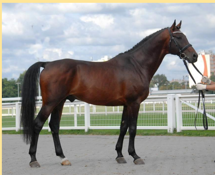
Furioso I (2007) „D” vonal