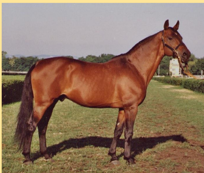
Furioso XV (1978)