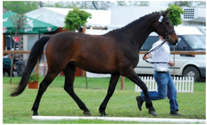
Hand North Star-89 Mambó, Állattenyésztési Napok, Hódmezővásárhely 2014.

ban reflektorfényben lévő szelethe a versenysport, ahol azonban lovaink megjelenése nemcsak a képességektől, hanem a dolgok kedvező összeállításától is függ. Van kistenyésztő, akinek kanca/lánya, kettesfogata eredményesen versenyez. Nagy örömmel gratulálunk, de érdemben nem tudunk beszállni a szponzorálásba. A sportoló lovak szerény támogatásán túl az elért eredmények követése, teljesítmény-elismerése, tenyészérték-beszámítása viszont elengedhetetlen.