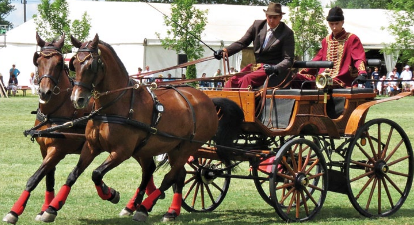
Vecsés CA12** Furioso-62 szellő, Furioso-39 Széplány(Hajtó: Sági József, tenyésztő Domokos Gábor)