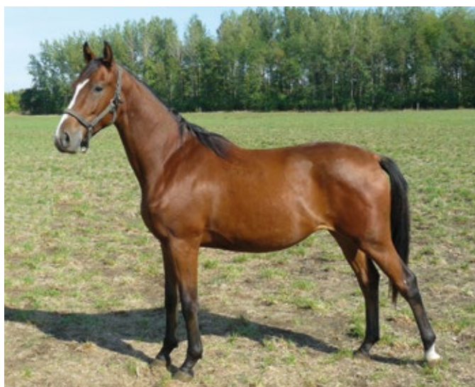
▲ THE BART Furioso II-103 „Pergő” | Szül.: 2011 Korona Ménés, Pálfa