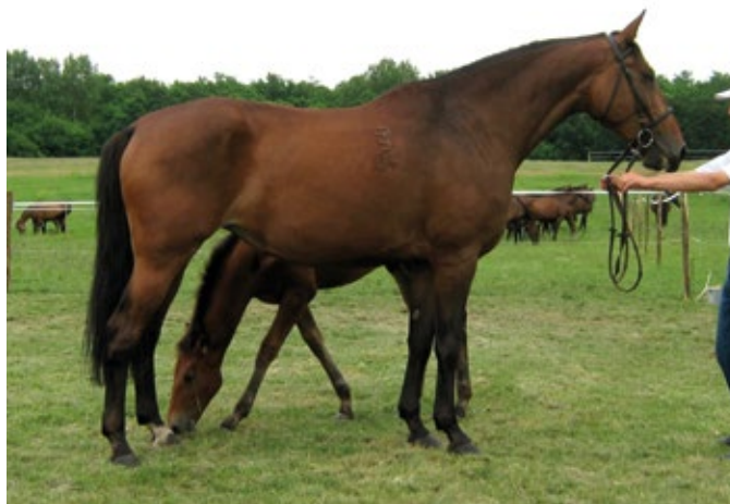
▲ FURIOSO XXVIII-22 „Pikáns” | Szül.: 2004 Farmer Kft., Bugac