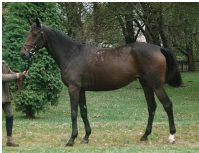
▲ 67 BŰVÖLŐ Furioso-55 „Pohár” | Szül.: 1993. Hubertus Bt., Pusztaberény

tulajdonosváltásig rendszeresen kerültek felvásárlásra fedezőménnek az állományból. (Napjainkig összesen 44 db, „sárvári” kanca után született tenyészmén fedezett a fajtában.) A következő tíz évet Bugacon töltötte a tenyészet, ahol a kezdeti lendület után a tenyésztési mutatók visszaestek, a szaporulat jó része elveszett a fajta számára, és sajnálatos módon a két kancacsalád néhány ága szintén veszteségeket szenvedett.