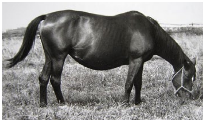
6. PEZSGÓ (Heléna kancacsalád) | Szül.: 1973. Leutstetten, Németország